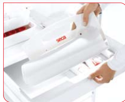
量垫可被卷起来保存，节省空间。