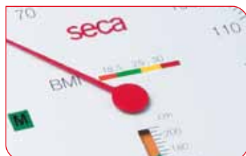
El disco BMI con divisiones en colores contrastantes permite comprobar fácilmente el Índice de Masa Corporal.